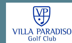
VILLA PARADISO GOLF CLUB